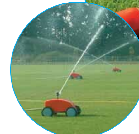
Flexibele systemen zijn zeer gebruiksvriendelijk.