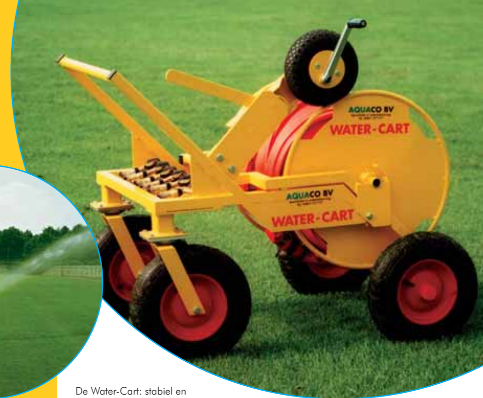
De Water-Cart: stabiel en transportabel slanghaspelsysteem.