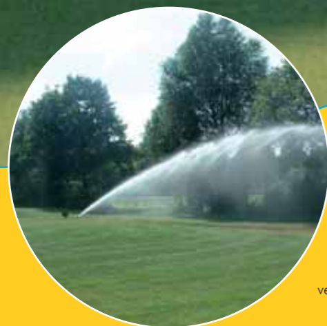
Beregening brengt sportvelden in topconditie.

Amsterdam Arena, Philips Stadion Eindhoven, De Kuip Rotterdam, Arke Stadion Enschede, Gelredome Arnhem, MHC Nijmegen, HDM Den Haag, HC Pinoké Amstelveen, Hockeyclub Haren, Hockeyclub Laren, Hockeyclub Den Bosch, Hilversumsche Golfclub, Golfclub Broekpolder, Oosterhoutse Golfclub, Golfbaan De Welderen Elst, Golfbaan Leende, Manege Nieuw Amstelland Amstelveen, CHIO Rotterdam, Stoeterij Buitenzorg Bommel, Sportpark Toolenburg (Pioneers) Hoofddorp, Sportpark Ookmeer (Pirates) Amsterdam, Sportpark Staddijk (Hazenkamp) Nijmegen. Maar ook talloze andere (amateur)verenigingen sporten op velden die in topconditie verkeren dankzij Aquaco