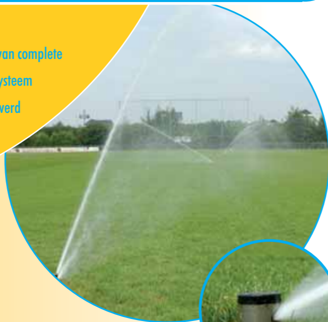
Inbouwsproeiers in natuurgrasveld.

Aquaco biedt klanten een breed productenpakket, gericht op het afleveren van complete sproei-installaties. Bij het ontwerpen en het plaatsen van een beregeningssysteem maakt Aquaco alleen gebruik van eersteklas materialen. Deze worden geleverd met garantie. Bovendien zijn de onderdelen ook los verkrijgbaar.